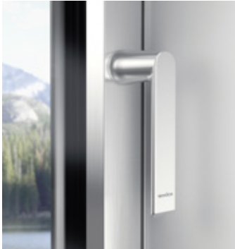
Rosettenloses Griffdesign Handle design without rosettes

Eigens für das neue Aluminium-Fenstersystem AWS 75 PD.SI wurde das neue rosettenlose Schüco Griffdesign entwickelt, um die besonders schlanken Flügelprofile ideal zur Geltung zu bringen.