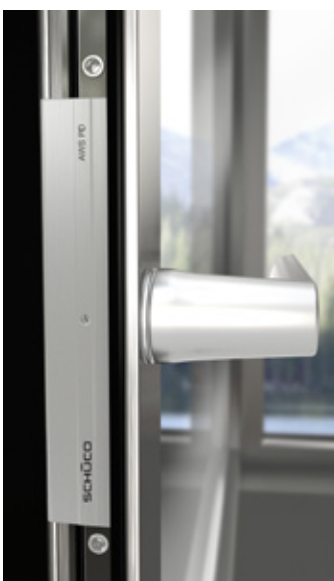
Panorama Design Einsteckgetriebe Panorama Design push-in gearbox