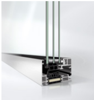
Schüco AWS 75 PD.SI Öffnungselement Schüco AWS 75 PD.SI opening unit