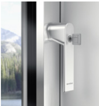
Rosettenloses Griffdesign, abschließbar Lockable handle design without rosettes

Burglar resistance class RC 2 can be achieved with the window system AWS 75 PD.SI.